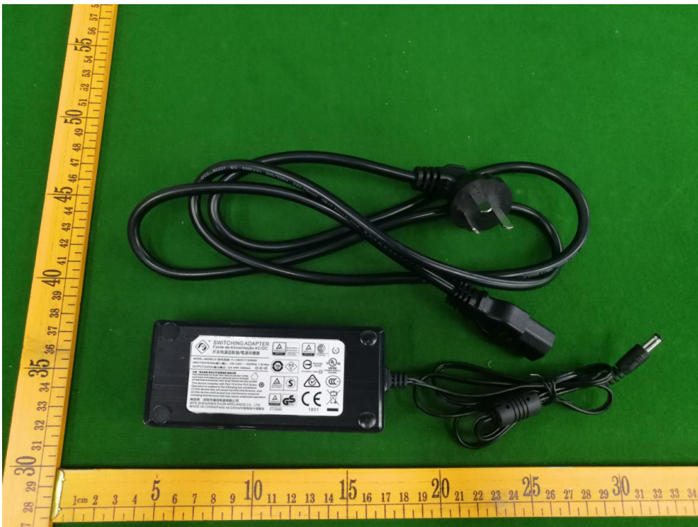
电源适配器与电线组件